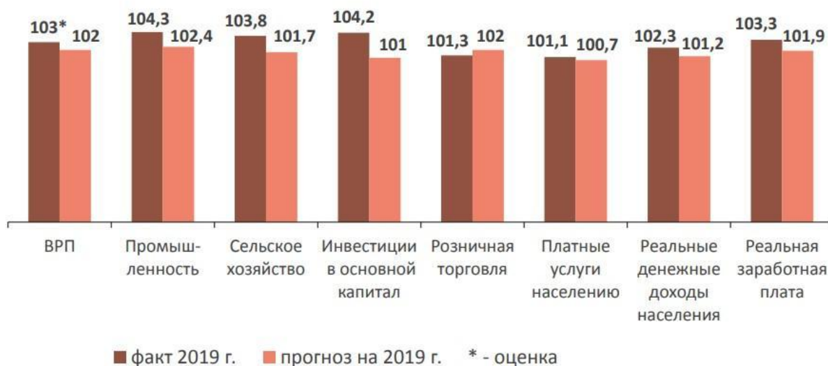
Рисунок 1. Итоги реализации прогноза социально-экономического развития региона в 2019 г., в % к 2018 г. в сопоставимых ценах

По приведенным данным региона определите – какие показатели для решения этих задач с учетом достижения целевых показателей для оценки эффективности деятельности высших должностных лиц, предусмотрены в целевом варианте прогноза. Как Минэкономразвития региона анализирует качество прогнозирования, как подводятся итоги реализации прогноза социально-экономического развития региона за год.